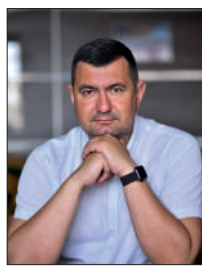
Ірина КОНСТАНКЕВИЧ, народна депутатка України.

Справжній успіх – це коли ти сам стаєш натхненням для інших. Нехай кожен, хто переступає поріг фахового коледжу, знаходить тут підтримку, знання та наснагу для здійснення своїх найсміливіших мрій!